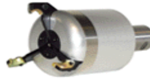
Grippex II Small